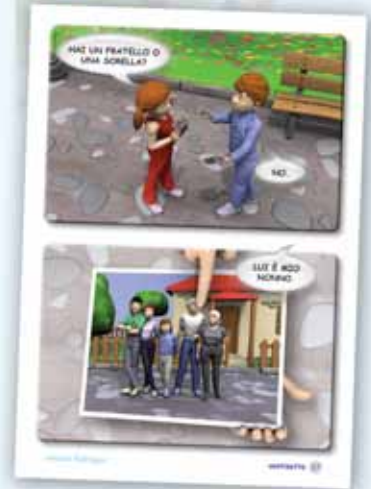
Al circo! Italiano per bambini Livello elementare