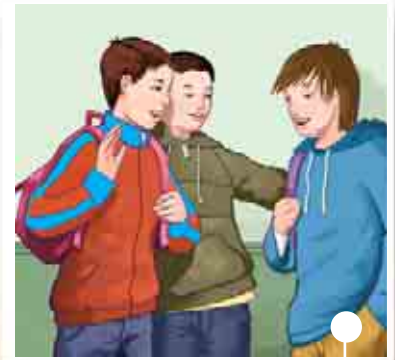
conoscere nuovi compagni