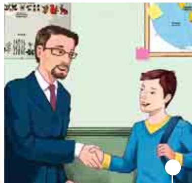
ritrovare i professori