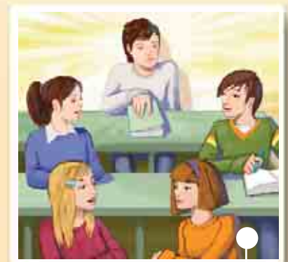
cambiare classe o scuola

3 Quali parole conoscete? Scambiatevi idee.