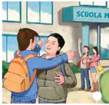
rivedere gli amici

1 Osservate le immagini e discutete: cosa è più bello il primo giorno di scuola?